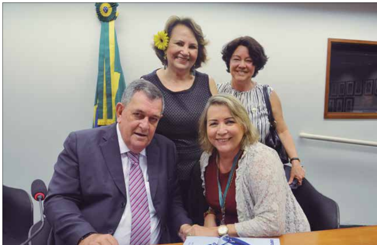
Deputado recebe conselheiras da ANFIP para entrevista ao ANFIP com Você

Acho que a crise política nos ajuda no momento para poder votar a PEC 555, aquela que aca-